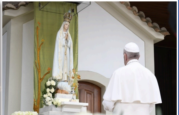
Vaticano: Papa agradece viagem de Fátima