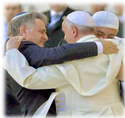
Um abraço de Paz