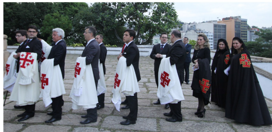
Entrada dos novos cavaleiros e Damas e as duas damas investidas em Jerusalém, na Terra Santa.

“Ser convidado para pertencer a Ordem é uma honra, mas também uma OPORTUNIDADE ÚNICA, PRIVILEGIADA DE SERVIÇO”