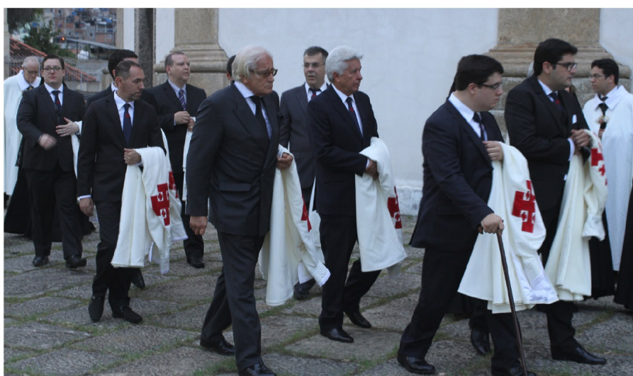
Entrada dos novos cavaleiros