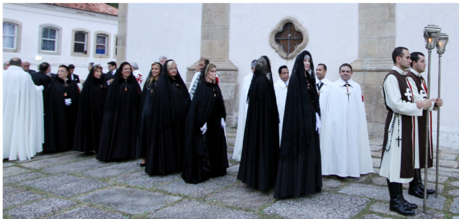
Procissão de Entrada