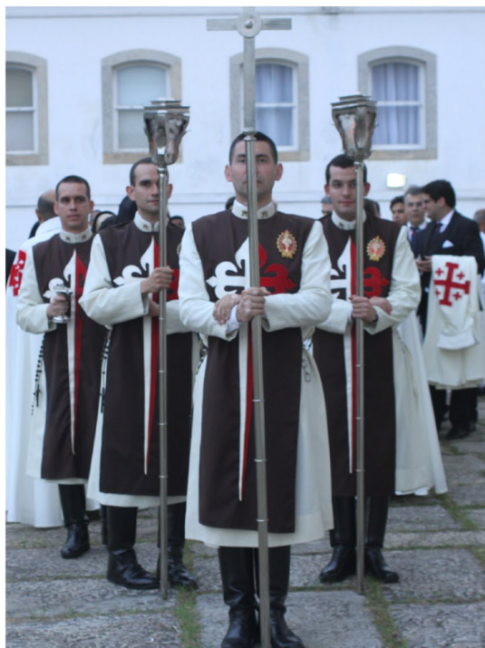
Os Araucos do Evangelho