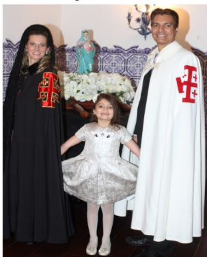
A princesa que invadiu a festa do casal