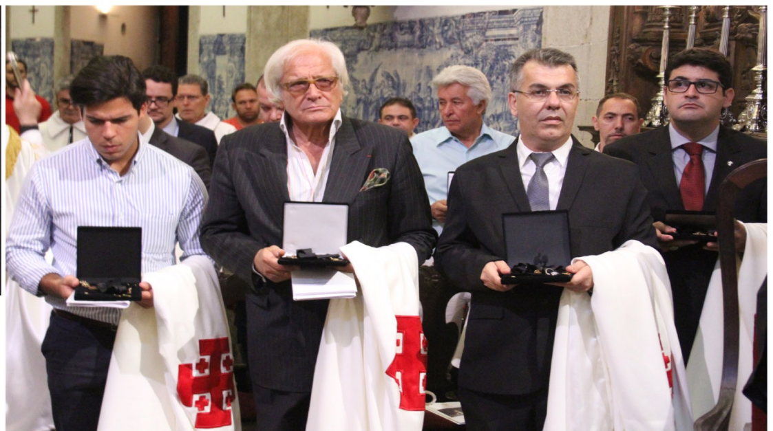
Cavaleiros no momento da benção das insignias e capa