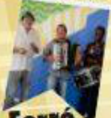
Forró Papa Goiaba