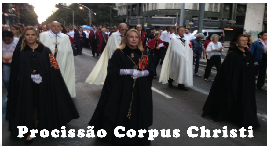
Procissão Corpus Christi