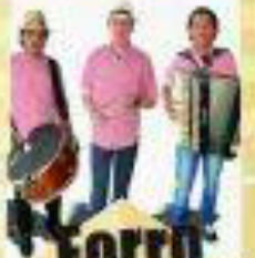
Forró No Compasso do Forró