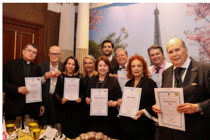
Camara municipal do Rio de Janeiro presta homenagem à OESSJ

O Jantar Beneficente realizado no dia 29 de abril, foi um grande sucesso com todos os convites foram vendidos e os lugares esgotados.