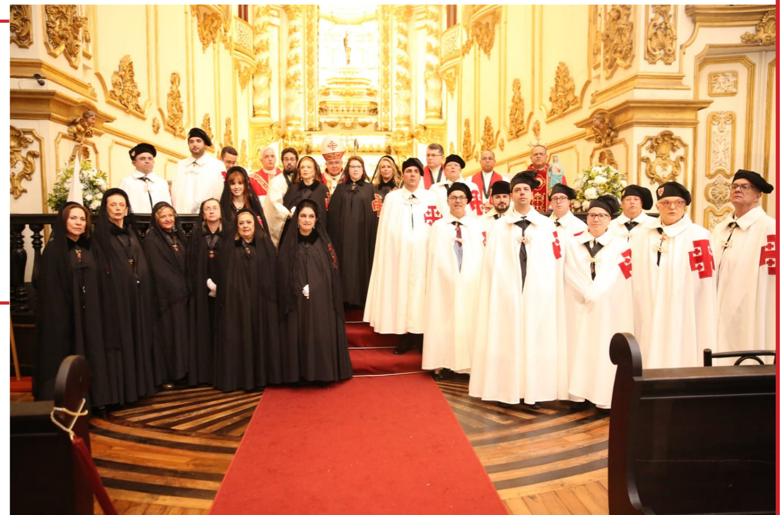
Cavaleiros, Damas e Eclesiásticos presentes com os novos investidos, Grão-Prior e a Lugar-Tenente

A cerimônia foi de grande beleza e riqueza espiritual com ritos que remontam às primeiras investiduras, mantendo firme o ideal de amor e ajuda aos cristãos da Terra Santa.