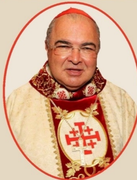
Dom Orani João, Cardeal Tempesta Grão-Prior da Ordem

ORDEM EQUESTRE DO SANTO SEPULCRO DE JERUSALÉM LUGAR-TENÊNCIA DO RIO DE JANEIRO (RJ)