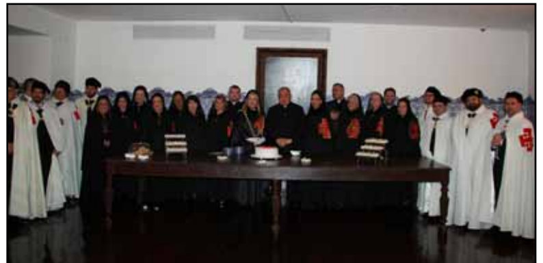
Foto tradicional dos Cavaleiros e Damas em torno da grande mesa do Salão de Festas do Outeiro, após a Investidura.