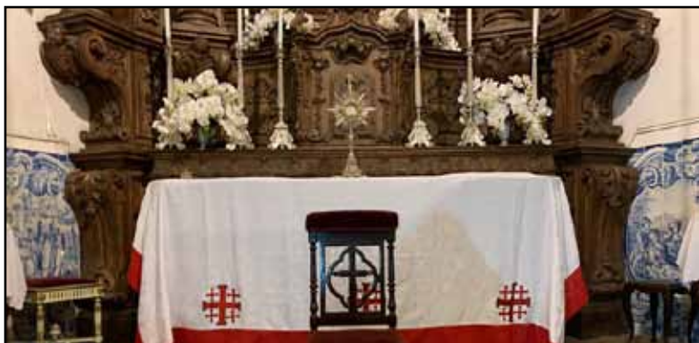
A Igreja de Nossa Senhora da Glória no Outeiro preparada para receber Cavaleiros, Damas e principalmente nos futuros Investidos para a indispensável Vigília D'Armas Velada.