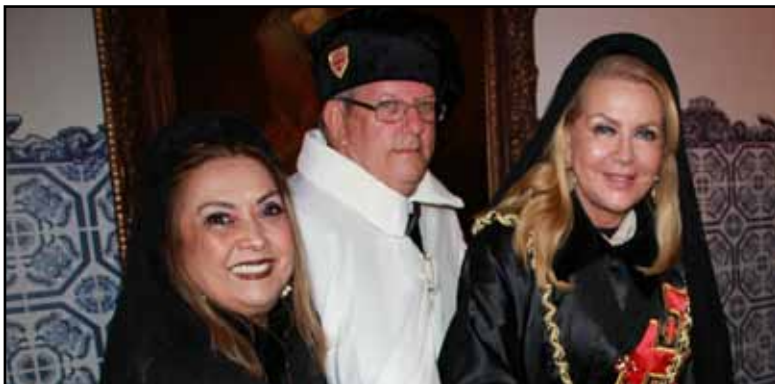
O tradicional bolo sendo cortado pela Lugar Tenente e novos Cavaleiro e Dama no coquetel, após a investidura.