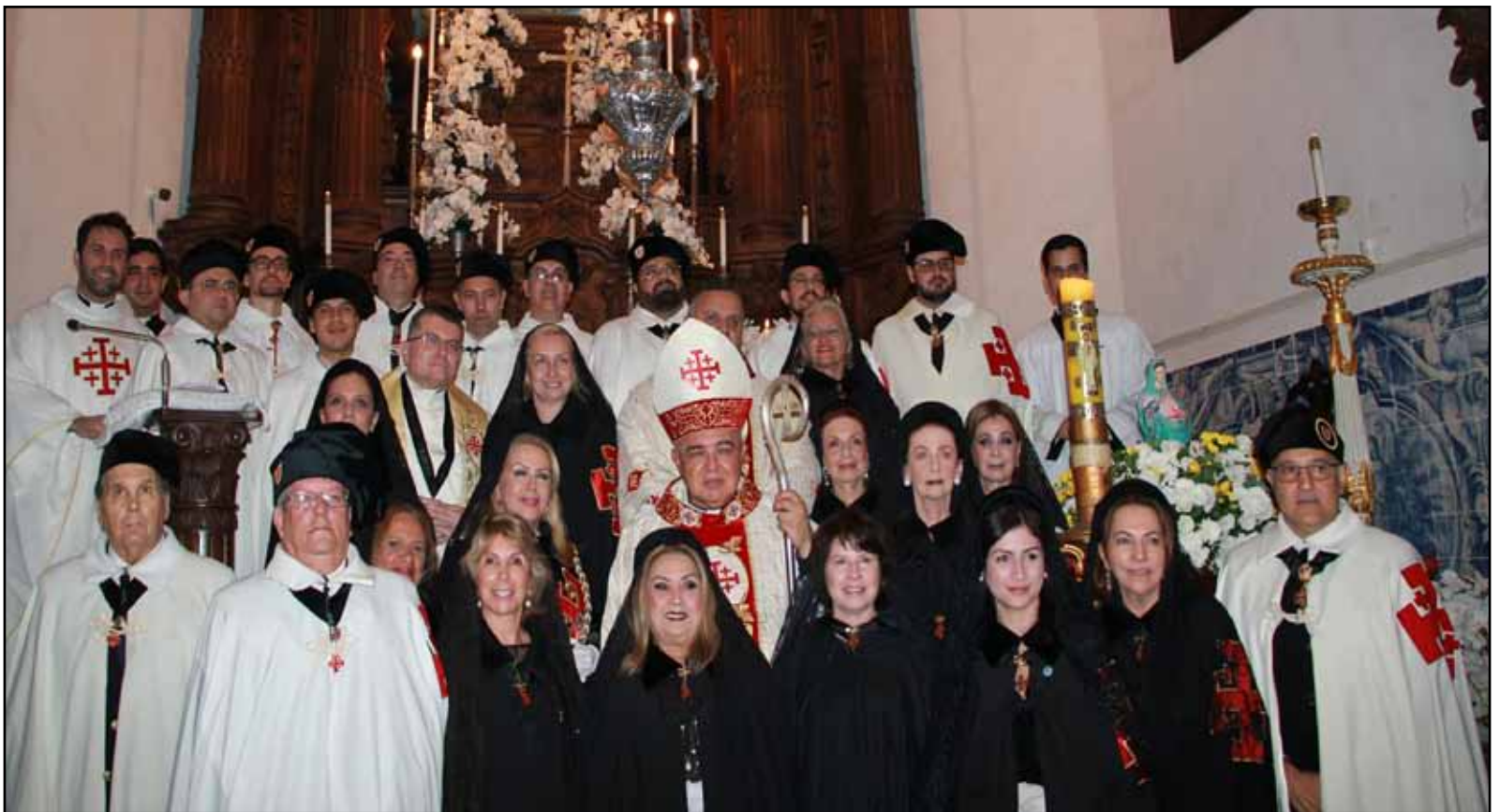
Cavaleiros e Damas da Ordem Equestre do Santo Sepulcro de Jerusalém na foto oficial realizada diante do Altar da Igreja de Nossa Senhora da Glória no Outeiro após a Cerimônia de Investidura realizada em 16 de maio de 2019