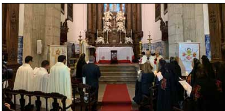
A Igreja de Nossa Senhora da Glória no Outeiro com mais de 3 séculos de história foi mais uma vez a escolhida para as cerimônias de Vigília D'Armas e Investidura