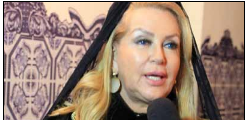
Em entrevista a Rede Vida, a Lugar Tenente falando da importância de mais uma Investidura na Ordem do Santo Sepulcro