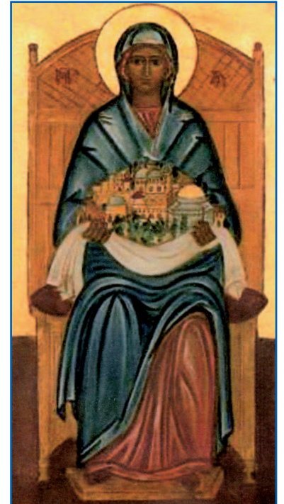
NOSSA SENHORA, RAINHA DA PALESTINA OUR LADY, QUEEN OF PALESTINE

Em 1927, o Patriarca latino Louis Barlassina fundou o Santuário de “Nossa Senhora, Rainha da Palestina” na localidade de Rafat, próximo da aldeia palestina de “Sar’á”.